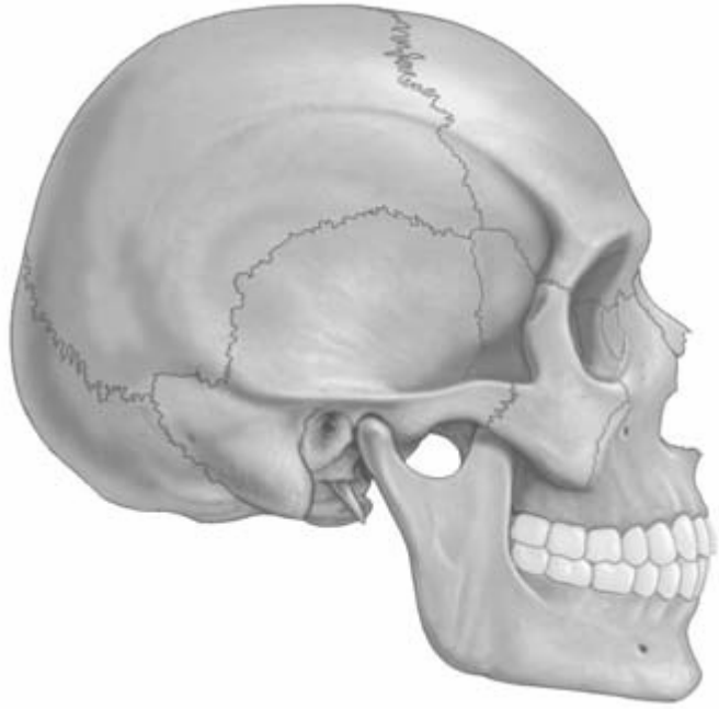
DIBUJO NÚMERO 2